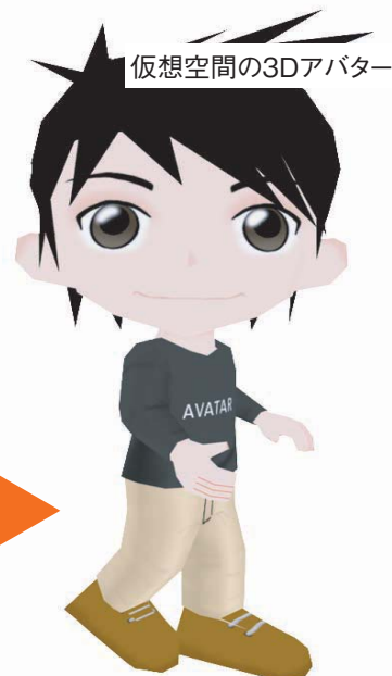
③他店で再度試着して購入