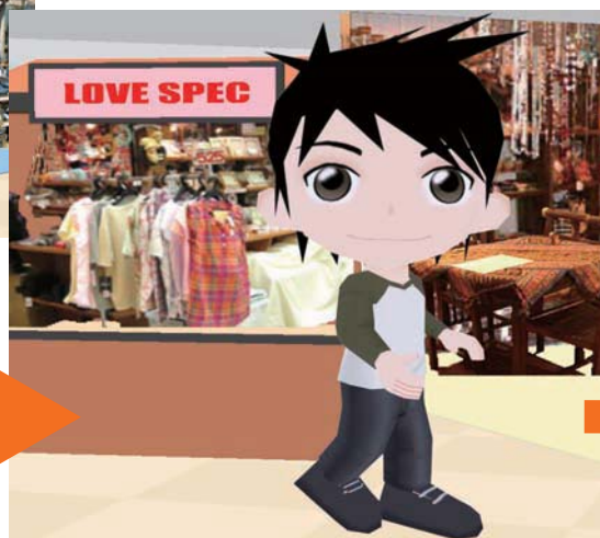
②他店で別のシャツに着替え回遊